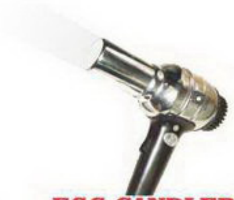
EGG CANDLER U/ meneropong telur

Untuk kapasitas kecil, tersedia gabungan Setter & Hatcher, kapasitas Hatcher lebih kecil dan kapasitas Setter yang menentukan jumlah produksi per 3 - 4 hari. Contoh : Type OS-3 mula-mula masukkan 88 telur pada rak pertama, tiga hari kemudian baru diisi lagi 88 butir ke rak ke dua dan seterusnya. Selanjutnya dapat memanen 88 ekor tiap 3 hari.